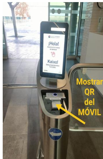
Acceder a las instalaciones